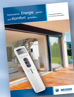
Brožura pro investory, rolety, 12 stran formátu A4

Společnost Becker-motory nabízí na podporu prodeje a propagaci produktů rádiového řízení zajímavé informační letáky.