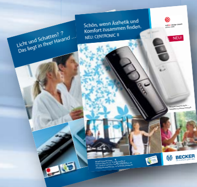
Leták, 2 strany formátu A4 Rádiová řízení rolet a program Centronic II